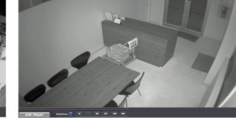
OTC-2IR(屋内ドーム型IRカメラ)

OTC-1IR (屋外用バレット型IRカメラ) ●1080P フルHD解像度 ●強力なハイパワーLED(照射距離50M) ●優れた防水性能(IP68) ●最長400Mの転送距離(5C-2V) ●落雷対策用の絶縁性ブラケット採用