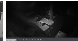
従来の屋内ドーム型IRカメラ

圧倒的な明るさのハイパワーLEDを搭載したIRカメラは、ドーナツ現象対策により画角内の被写体全体が従来のカメラに比べ、クリアに投影されます。