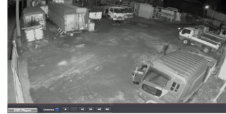
OTC-1IR(屋外用バレット型IRカメラ)

圧倒的な明るさのハイパワーLEDを搭載したIRカメラは、ドーナツ現象対策により画角内の被写体全体が従来のカメラに比べ、クリアに投影されます。