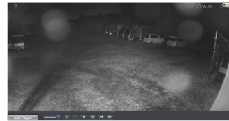
従来の屋外用バレット型IRカメラ

赤外線照明照射により、白色の被写体は特に明るく投影されますが、ドーナツ現象により画角の中心部のみ明るく、周囲は暗い映像になってしまいます。